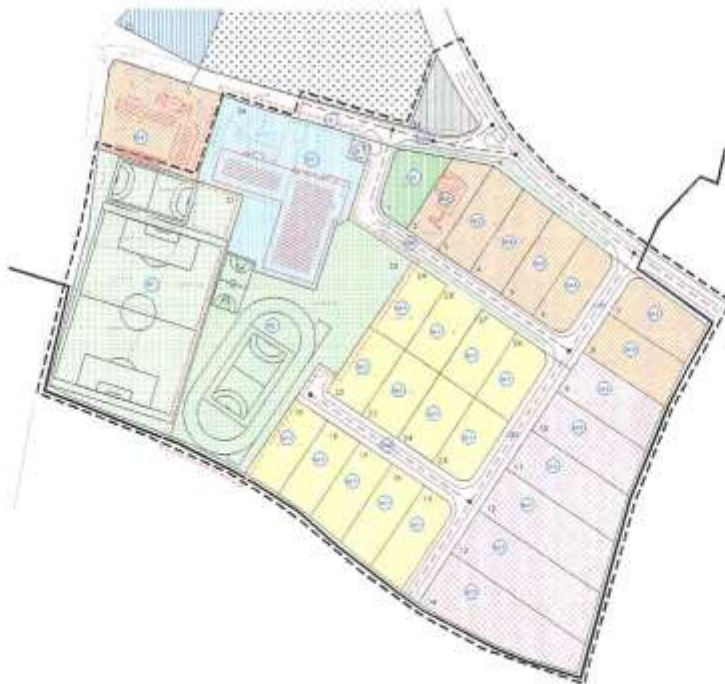
Prikaz 1 Područje obuhvata DPU

Općinski interes je zemljište neposredno zapadno uz zgradu osnovne škole u Podturnu, koje je prema Prostornom planu uređenja Općine Podturen u zoni centralnih sadržaja, a koje se nalazi izvan obuhvata DPU, i na kojem se danas nalaze prostori sportskog kluba, prenamijeniti u površinu za predškolsku ustanovu, a sportski klub izgraditi unutar površine namijenjene sportu i rekreaciji.